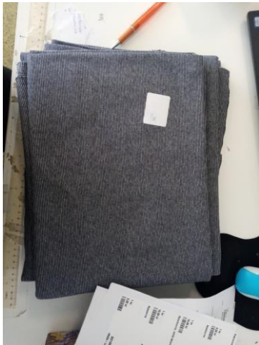
Příklad tříděné látky

Praxi jsem absolvovala v obchodním oddělení, kde expedují a balí zakázky firmy a starají se o zboží ve skladu. Dále jsem pracovala na stříhárně, kde se připravují a stříhají látky pro šití. A také jsem byla v technologickém oddělení, ve kterém se vymýšlí nové stříhy a také se polohují v programu pro cutter pro efektivnější řezání a šetření materiálu.